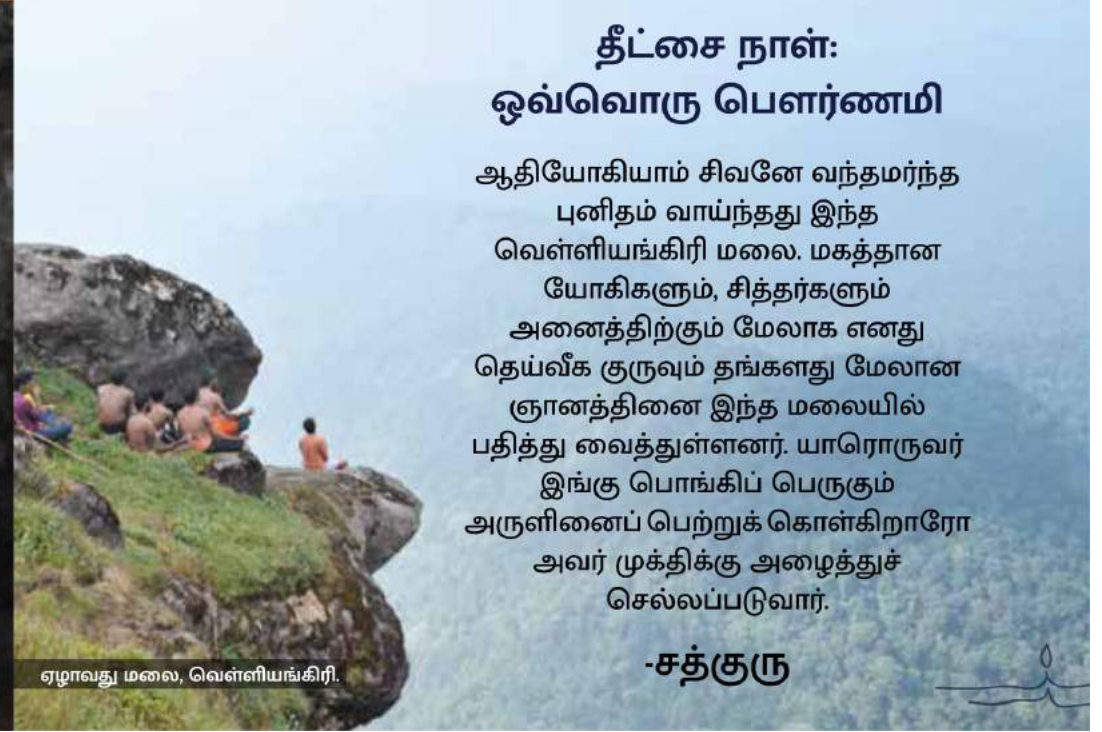
ஏழாவது மலை, வெள்ளியங்கிரி.